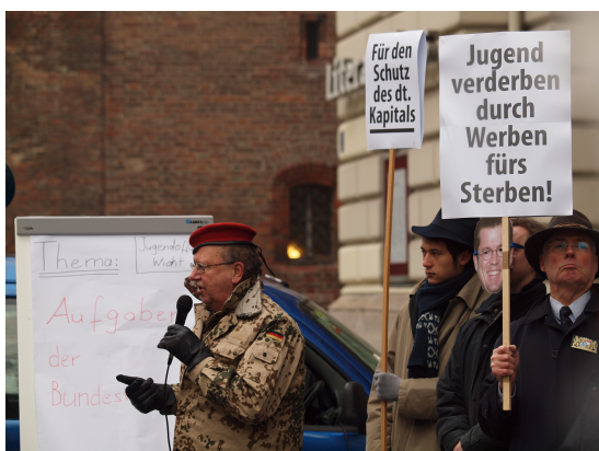
Bilder von unserer Aktion vom 28. Januar 2011 "Wer will unter die Soldaten?"

Nicht mehr wir Eltern, Lehrerinnen und Lehrer werden die Welt erklären, sondern die „Experten“ der Armee. Diese sollen zukünftig bestimmen, welchen Vorbildern die Jugend folgt.